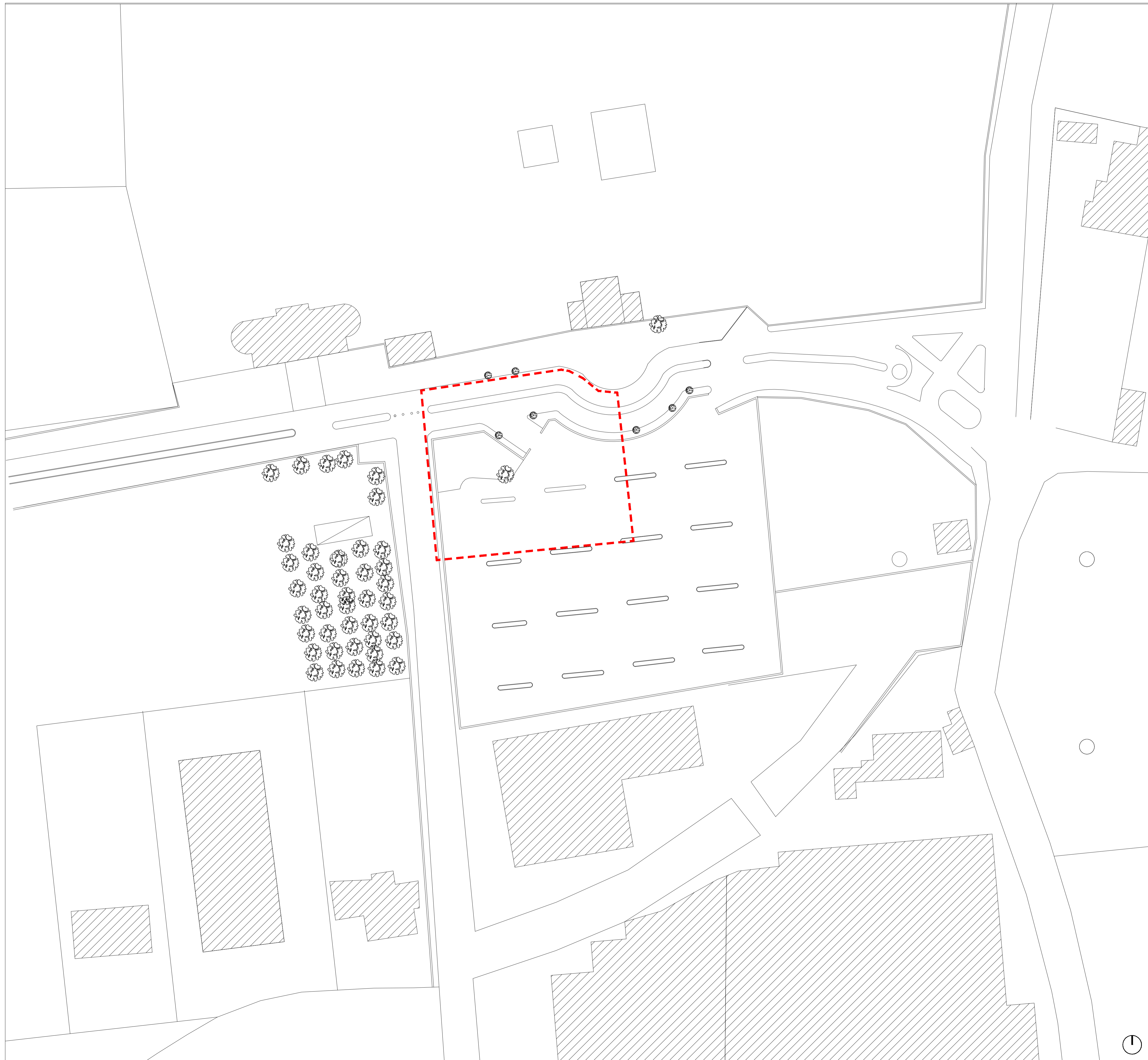
Planimetria d'insieme - stato di fatto - scala 1:500